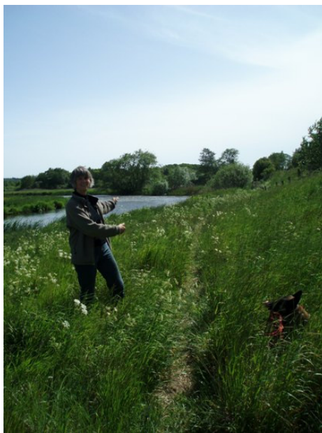
Langå, retning mod Mosevej