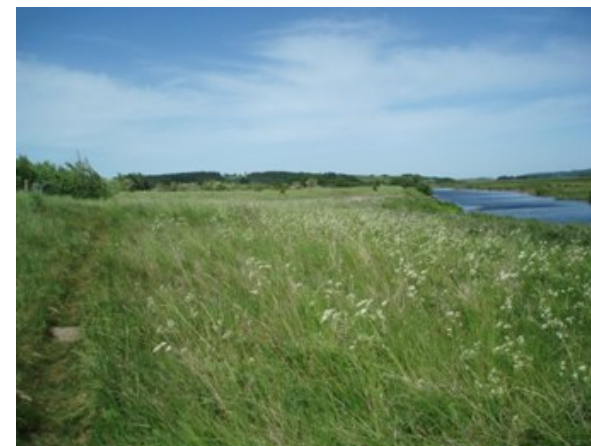
Langå, retning mod Randers